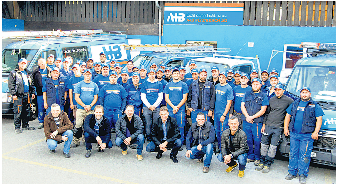
Das A+B Flachdach AG-Team, fachkompetent und freundlich, berät Sie gerne.

Zu den Angeboten der Firma gehören Neubauten und Sanierungen von Flachdächern, ihrer Kernkompetenz. Dabei werden klassische und neuere Abdichtungen und Wärmedämmungen verwendet. A + B Flachdach AG verrichtet auch die zur Installation der Flachdächer gehörenden Spenglerarbeiten. Nebst der klassischen Flachdach-Spenglerei bietet sie