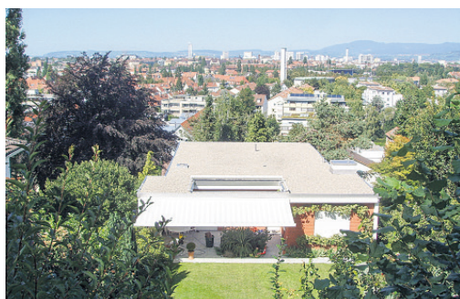
Hasenrainstrasse Binningen, EFH Flachdach-Sanierung.