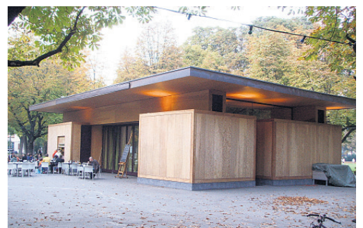
Pavillon Schützenmattpark, Neubau.