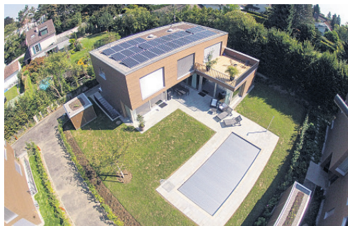
Neubadrain Binningen, Neubau EFH mit PV-Anlage.