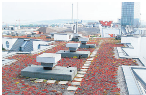
Messe Basel Kongressgebäude, Flachdach-Sanierung.