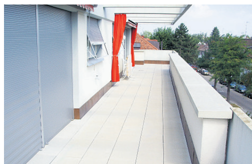
Steinbühlallee Allschwil, Terrassen-Sanierung.